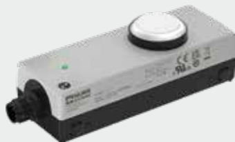
IO-Link 1 Drukknop 42 1NO L M12(4)